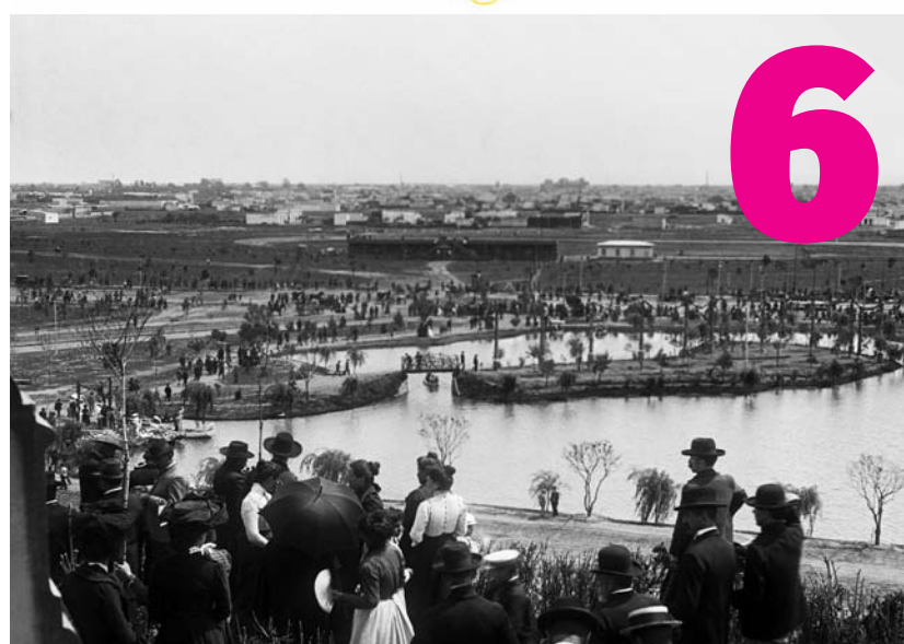
De Rosario entre dos siglos (1890-1910). "Inauguración del Parque, 1º de diciembre de 1902".